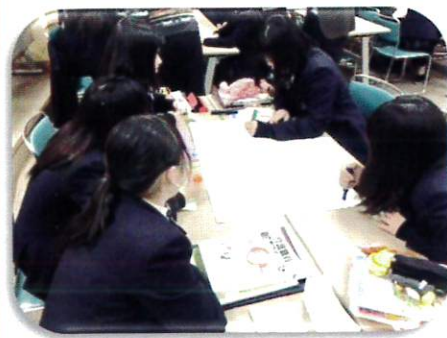
過去の講座の様子

毎年、2月に名古屋大谷高等学校で医療福祉コースの学生さんを対象に開催していた“みずほたすけ愛ネット主催「認知症について学んで一緒に地域を支えよう」”今年2月25日（金）で45名の学生さんを対象に準備を進めていました。今年に入り、新型コロナウイルス感染者数の急増、愛知県「まん延防止等重点措置」の発出などもあり、本年度の開催を断念、来年度の早めでの開催になりました。