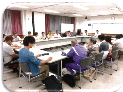
わくわくみずほまつり実行委員会（第1回）